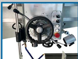
Volant de déplacement du chariot