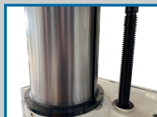
Large colonne Ø240mm