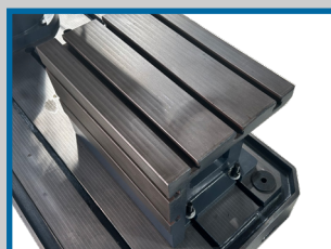
Table de travail rainurée